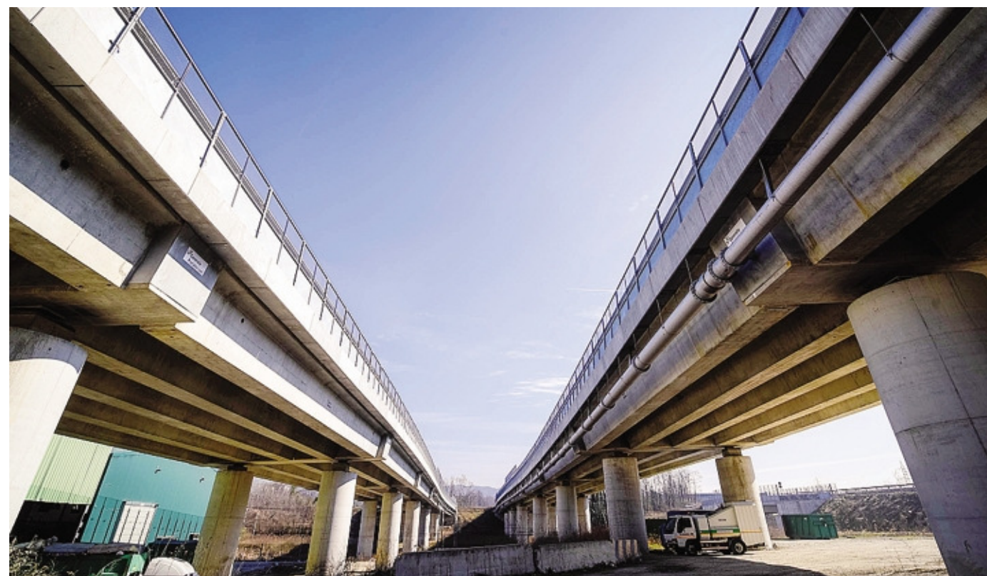
La parte finale della tangenziale ad Albate: proprio qui avrebbe dovuto innestarsi il secondo lotto diretto ad Albese

Sette anni fa lo stralcio. Il progetto definitivo era stato stralciato sette anni fa dall'allora governatore Roberto Formigoni perché «troppo costoso». Adesso ci sono due ipotesi di studio per cercare di contenere la cifra. La prima riguarda il sistema di scavo cosiddetto "a talpa". In pratica si tratta di un macchinario in grado di scavare in roccia, anche molto resistente come nel caso della galleria di base del San Gottardo, oppure al di sotto di falde acquifere, come nel caso della metropolitana di Napoli. Questo metodo di lavoro, almeno stando alle previsioni dei tecnici, dovrebbe ridurre sensibilmente il costo rispetto a quanto previsto set-