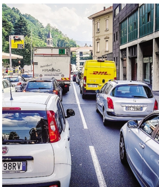
Code in via Pasquale Paoli: una scena che si ripete tutti i giorni

Sette anni di stallo Il tema del secondo lotto della tangenziale, dopo sette anni di stallo, è sul tavolo della politica chiamata a definire in tempi brevi una road map per rilanciare il collegamento. Cento giorni per chiarire se si potrà avviare la fase di ricerca delle risorse (alcune centinaia di milioni di euro) per realizzare il collegamento che dovrà essere interamente finanziato dal pubblico. Entro ottobre Infrastrutture Lombarde dovrà completare uno studio per approfondire la questione dei co-