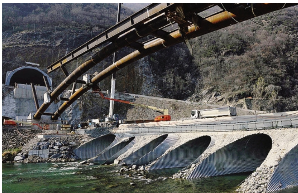
Opere pubbliche ferme per un settore che ancora fatica a riprendersi dalla crisi

Ha pesato anche l'assenza di un periodo transitorio e questo è riconosciuto da ambo le parti. L'urgenza di mettere le mani nella riforma vale doppio considerando anche un altro elemento: il periodo elettorale, che non è amico solitamente dell'edilizia. Lo sottolineava al convegno Fagioli: dopo qualche segnale di timida risalita, il finale del 2017 a Como ha segnato una nuova stasi che si teme possa durare fino alle elezioni. M. Lua.