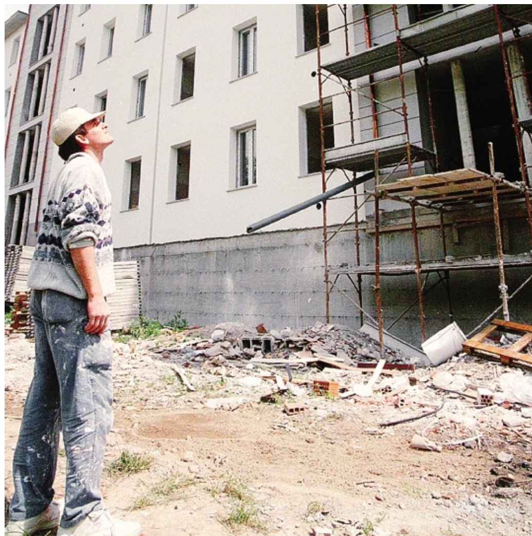
Le agevolazioni fiscali hanno sostenuto gli interventi di riqualificazione energetica

E qui entriamo nel campo dell'Internet delle cose, un tassello fondamentale dell'economia circolare. Su cui gli artigiani lariani non sono affatto indietro: lo dimostrano anche le più recenti fiere del territorio, da ComoCasaClima ad Altecnologia a Lariofiere. La domotica è risorsa garantita dalla professionalità e dall'aggiornamento dei piccoli. Il 66% delle imprese ha affinato negli ultimi tre anni le competenze, sia per l'energia sia per fonti rinnovabili e Internet delle cose. E danno il buon esempio in casa, visto che una su tre o ha già effettuato o sta per eseguire un intervento per migliorare l'efficienza energetica.