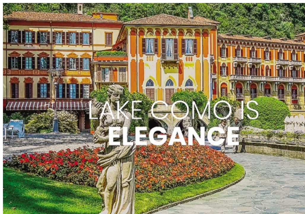
Una delle immagini simbolo sulla homepage del nuovo sito