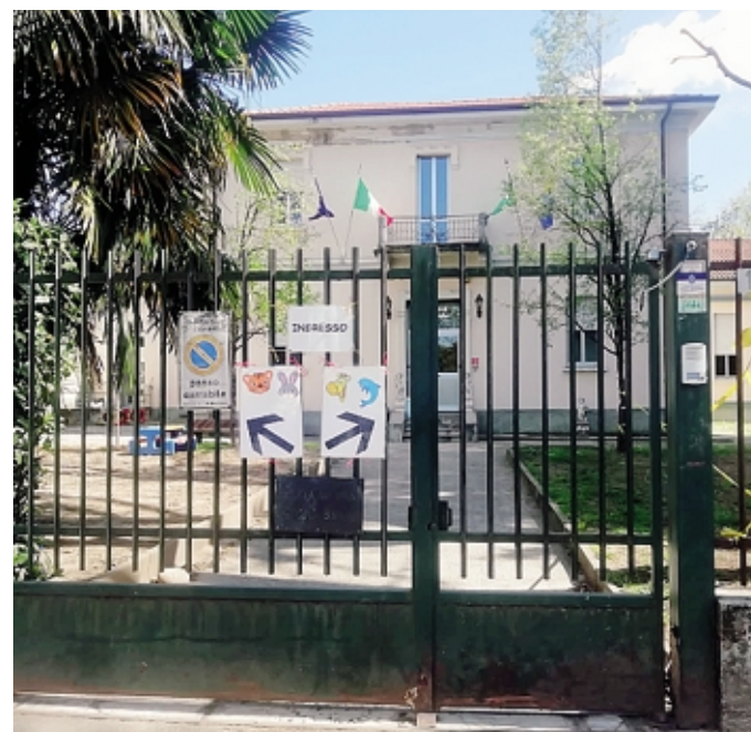
La scuola materna Garibaldi di via Passalacqua Trotti

Così l'assessore è pronto a tagliare il nastro alla partenza di uno dei cantieri più importanti per la città, vinto dalla stessa impresa che si è aggiudicata l'intervento da mezzo milione per il recupero del piano terra di Villa Sormani, la "EdilGrande". «La gara si è